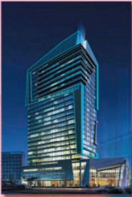
上海閘北廣場二期夜景 (構想圖)