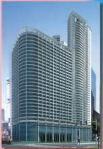
廣州海珠廣場 (構想圖)