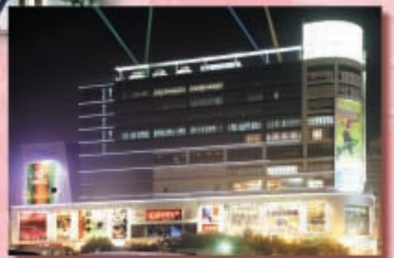
廣州五月花商業廣場