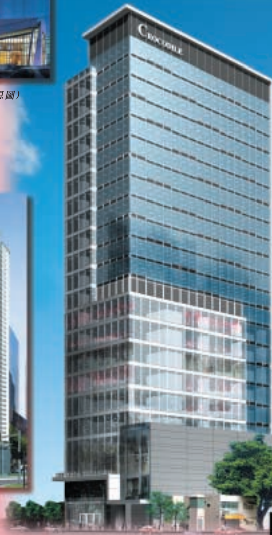
鱷魚恤大廈 (構想圖)